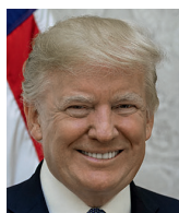
Donald J. Trump

Jestli mohou Facebook, Twitter a YouTube cenzurovat mě, mohou i vás. A věřte mi, že to dělají.