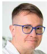
Roman Šmucler prezident České stomatologické komory

Prvotní dopad války na Ukrajině je hospodářský. Naše ekonomika musí unést ještě rychlejší inflaci, platit krátkodobě výdaje na pomoc Ukrajincům i dlouhodobě vyšší výdaje na zbrojení. Věřím, že to vše Česká republika zvládne. Nejsem si však jistý, jestli naše země zvládne útok na svobodu myšlení a vyjednávání.