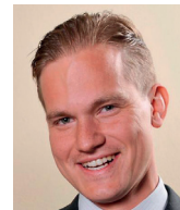
Tomáš Břicháček právník a publicista

I proto lze očekávat alespoň částečné nebo dočasné přehodnocení některých evropských environmentálních cílů, například uvádění půdy do klidu a snížení ploch určených k „neprodukcí“. Obavy lidí z růstu cen a poklesu jejich životní úrovně budou ovšem také pravděpodobně politicky zneužity v různých podobách k omezování občanských, obchodních a dalších svobod, a k různým projevům regulací. Mezi ně mohou patřit například zákazy exportů zemědělských komodit, změny ve zdanění potravin nebo specifické dotační programy podporující některé komodity a komunity na úkor jiných. Výsledkem tak patrně bude prohlubování rozdílů ve společnosti, zejména sociálních, ale také v přístupu k řešení nových výzev v rámci EU, včetně přístupu k členství Ukrajiny.