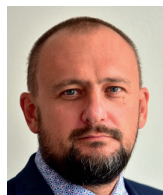
Jiří Horecký prezident Unie zaměstnavatelských svazů ČR