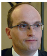
Jan Sechter náměstek ministra dopravy

Rusko a Bělorusko. Kéž by uvedené skutečnosti vedly k přechýlení české agrární politiky směrem od závislosti na jejich dovozu směrem k vyšší potravinové soběstačnosti, k podpoře produkčních zemědělců a ke zkrácování cesty jídla „od vidlí po vidličku“. Bio-seno a mokřady nás neuživí. Ostatně dnes už ani nemůžeme počítat s tím, že plány Rusů zhatí, naši vepři boubelatí, protože domácí prasata jsou v České republice téměř na vyhynutí.