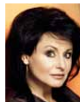
Renata Vesecká, bývalá Nejvyšší státní zástupkyně

Pevně věřím, že jsme si na korupci ještě nevykli, že většina lidí vnímá, že uplácet není normální, a že i bez korupce se dá slušně žít a úspěšně podnikat.