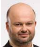
Martin Pecina, ministr vnitra ČR

V žebříčcích vnímání korupce ve veřejném sektoru se Česká republika v posledních letech pohybuje na chvostu vyspělých, nejen evropských, zemí. Nevím, zda se u nás skutečně uplácí tak často jako v Namibii, Malajsii či v Jordánsku, nicméně o jednom závažném faktu tyto výsledky vypovídají. Tím je skutečnost, že česká veřejnost ztrácí důvěru ve státní instituce, o důvěře v politické strany už téměř nelze hovořit.