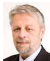
František Bublan, senátor za ČSSD

Odpověď na otázku „Jak efektivně bojovat s korupcí?“ přesahuje stanovený rozsah příspěvku, ale rád se k ní vyjádřím kdykoliv v budoucnu.