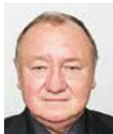
Vítězslav Jandák poslanec Parlamentu za ČSSD

Boj proti dezinformacím zkrátka nenáleží ze své podstaty zneužitelnému politicky řízenému ministerskému aparátu. Další zbytečný úřad. Vězte, že každá dezinformace někomu slouží, stejně jako bude někomu sloužit označení pravdy za dezinformaci. Vždy půjde o politiku a moc. A tak to v době svobodných médií a internetu (tedy není-li zároveň v plánu jejich konec, což není zcela jisté) nechme na čtenáři samotném. Jen doufám, že ministr vnitra, před svým definitivním odchodem z úřadu, nezapomene CTHH zase zrušit. Jeho nástupce ho tak nebude moci přetvořit na opravdu nebezpečný cenzurní úřad, hlasatele té jediné, oficiální nepravdy.