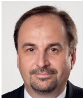
Jan Kohout bývalý ministr zahraničí ČR

Nepokoje v 60. letech propukly v amerických univerzitách, jejichž vliv pak utvářel kulturní a politické prostředí. Tím vlivem je iracionalismus, emocionalismus a nihilismus. Praktickým projevem jsou rozbité výlohy, vypálené obchody a zničené sochy, nikoliv rozumná diskuze o principech. A veřejnost, která tomu čelí, je morálně odzbrojena. Lze-li současný stav nazvat kulturní válkou či revolucí, její projevy budou stále ostřejší a nebudou se držet jen v hranicích USA – což už vidíme. A důležité je, že v této válce si nelze vybrat ani jednu stranu: alt-right uskupení, příznivci prezidenta Trumpa, nacionalisté, proti nim hnutí Black Lives Matter a progresivní levičáci – všichni jsou produktem stejného dlouhodobého filozofického působení. A hlas racionality zní v tom všem křiku zoufale slabě.