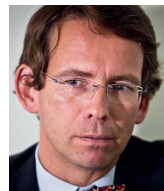
Petr Drulák politolog, Ústav mezinárodních vztahů

Mě osobně znepokojuje hlavně to, jak moc se tendence „klekat, odprošovat, sebe-mrskat“ rozšířila do vedení velkých firem. U tisku a kulturní sféry to dávno nikoho nepřekvapuje, ale u výrobců zmrzliny nebo softwarových koncernů je to špatné znamení. Zvláště ti poslední nám mohou svoje názory vtisknout, ať chceme, či nechceme.