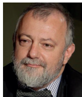
Hynek Kmoníček velvyslanec ČR v USA

Probíhající demonstrace ve více než 75 amerických městech jsou periodicky se opakujícím vrcholem dlouhodobého systémového problému současných USA. Tento problém je sociální, ekonomický, kulturní i rasový. Stávající „společenská smlouva“, předpokládající definici kdo je Američan, jaké má hodnoty, co chce od svého státu, které hodnoty stát zpětně oceňuje a jak, přestává vyhovovat dnes existující realitě v mnoha různých oblastech.