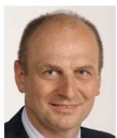
Petr Gandalovič velvyslanec ČR při OECD a bývalý velvyslanec ČR v USA

Rasový problém nemá jednoduché řešení nikde na světě, a nejméně ze všeho ve Spojených státech amerických. Zákon a pořádek versus appeasement rozzuřených menšin je ale téma, které rozhodne prezidentské volby, a to není málo.