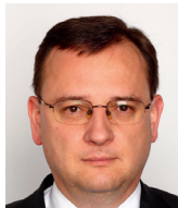
Petr Nečas bývalý premiér ČR

Na celé věci nejsou ani tolik zneklidňující samotné nároky aktivistických organizací a latentní násilí militantních skupin, jako chování establishmentu, a to nejen v USA, které netolerantnímu hnutí směřujícímu k potlačení základních hodnot a principů svobodné společnosti ustupuje a dokonce nadbíhá. Praktiky, které Západ zažíval pouze v éře nacismu a komunismu, jako zakazování knih a uměleckých děl, kácení soch a umlčování a štvávanie na nepohodlné, se nyní dějí tolerovány či akceptovány veřejnou mocí formálně demokratického státu za potlesku kulturních a mediálních elit. Nejen USA, ale celý západní svět se sunou k zásadnímu vnitřnímu konfliktu.