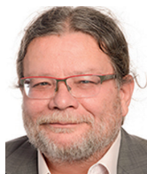
Alexandr Vondra europoslanec za ODS, bývalý velvyslanec ČR v USA

Současná krize také ukázala, jak psychologicky nesmírně důležitě efektivní je pracovat s pojmem útisku. Věděl to už Marx, který svou filozofii postavil na útisku dělnické třídy. To bylo nicméně v polovině 19. století. Že se dnešním revolucionářům podaří vytvořit dojem útisku (menšin, žen, homosexuálů a translidí) i v nejsvobodnější společnosti na světě – v té západní – pak nutno považovat za snad nejuspěšnější marketingovou kampaň v dějinách.