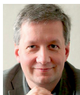
Zdeněk Koudelka ústavní právník

Náš právní řád zajišťuje rovnost a trestá násilí na lidech. Istanbulská úmluva o násilích na ženách zde nic nepřináší. Chceme-li právo změnit, lze tak učinit i bez istanbulské úmluvy.