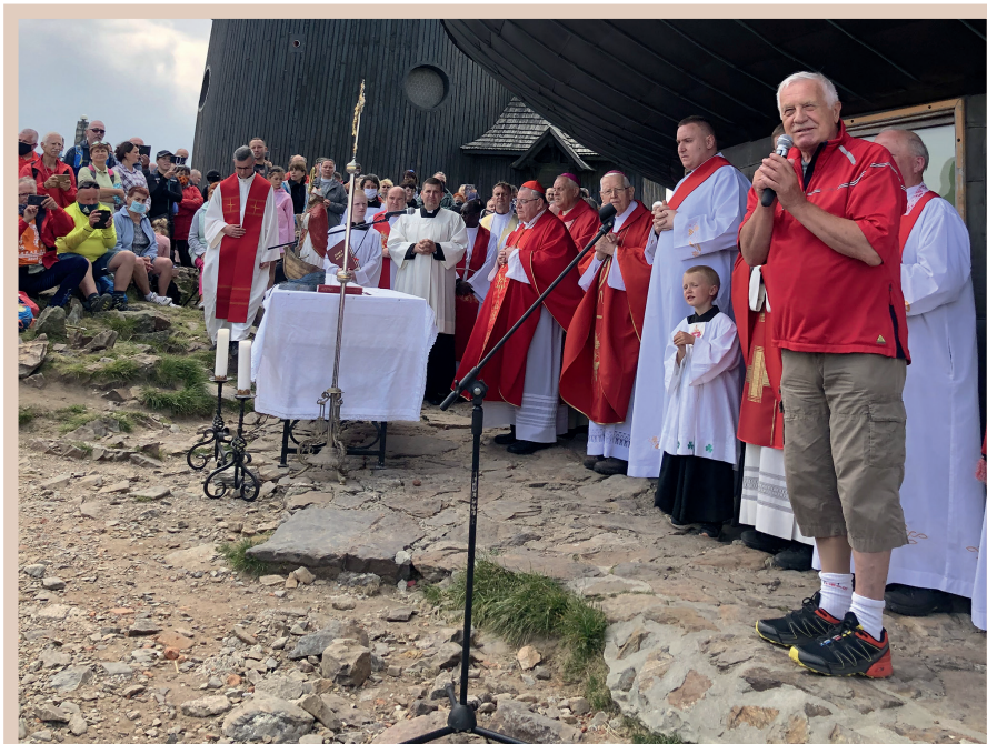
Václav Klaus na Sněžce. Tradice nejsou zbytečné. Ta svatovavřínecká na Sněžce trvá už třetí desetiletí. Na shledanou zase za rok.

Způsob, jak se k celému problému staví drtivá většina domácí politické scény pouze obnažuje její bídu a ochotu bez odporu přijímat a podbízivě se podvolovat diktátu ze zahraničních metropolí. Jak jinak si vysvětlit skutečnost, že ještě v průběhu mimořádné schůze poslanecké sněmovny před několika dny, která se tématem ohromného evropského zadlužení valícího